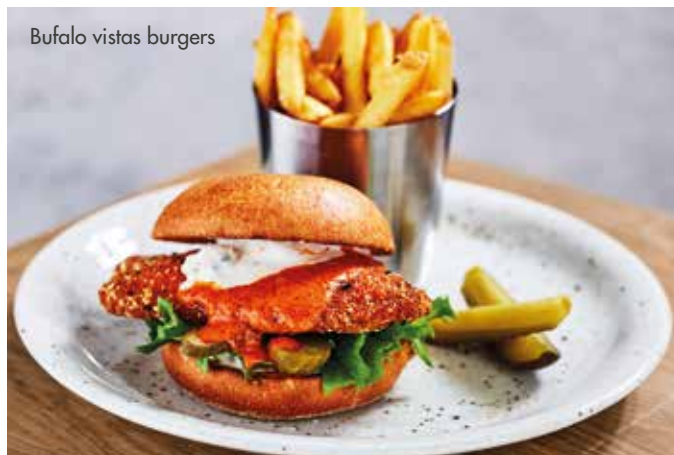
Bufalo vistas burgers