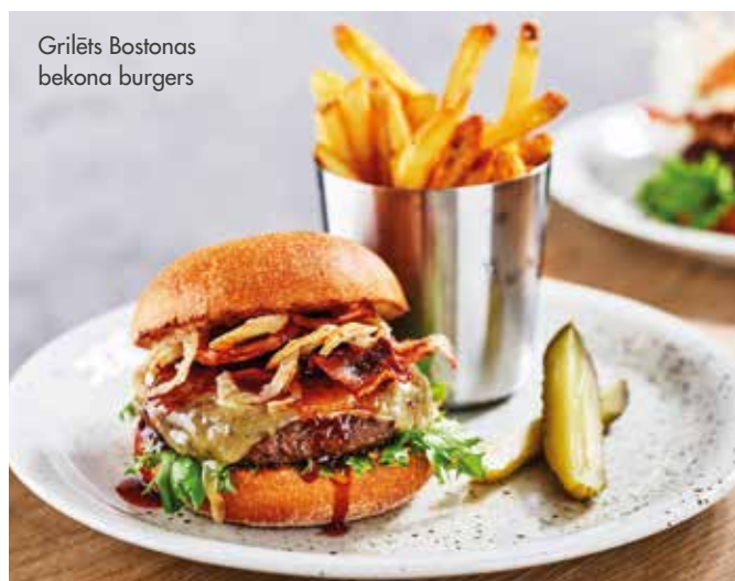
Grilēts Bostonas bekona burgers