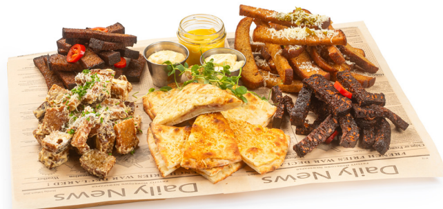
Maizes uzkladu komplekts