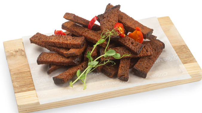
Karamelizētie maizes grauzdiņi

Gurķi, seleriju nūjiņas, ķiršu tomāti, svaiga paprika, marinēti gurķi, melnās olīvas, peperoni pipari. Pasniegti ar Ranch mērci. 22.00 €