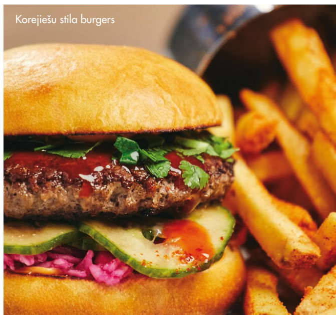
Korejiešu stila burgers