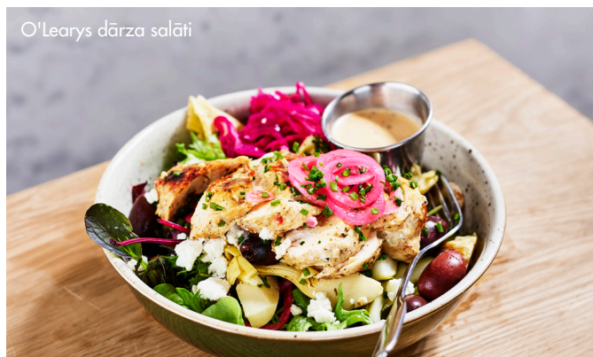
O'Learys dārza salāti