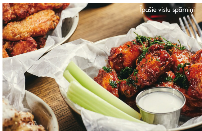
Īpašie vistu spārniņi