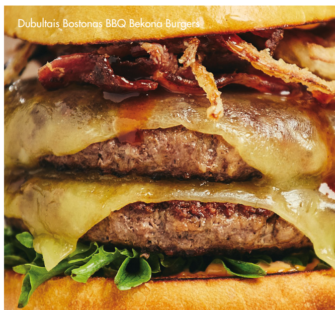
Dubultais Bostonas BBQ Bekona Burgers

Kraukšķīgi cepta vista ar Ranch mērci, marinētiem gurķiem, kraukšķīgām salātu lapām un Buffalo mērci. 13.00 €