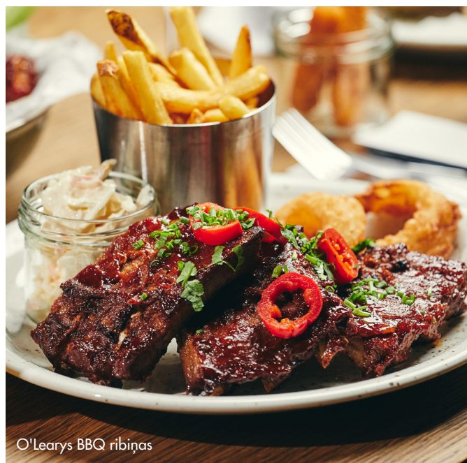
O'Learys BBQ ribiņas

VISTA 12.00 € | OUMPH! 13.00 € | GARNELES 15.00 € Pasta ar cieto sieru, saldo krējumu, pikantiem pico de gallo dārzeņiem. Pasniedz ar siera-ķiploku maizi un gaļu pēc jūsu izvēles.